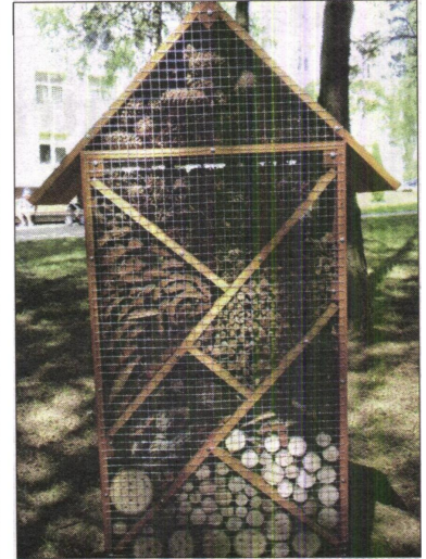
Šių metų naujiena – vabzdžių namai.