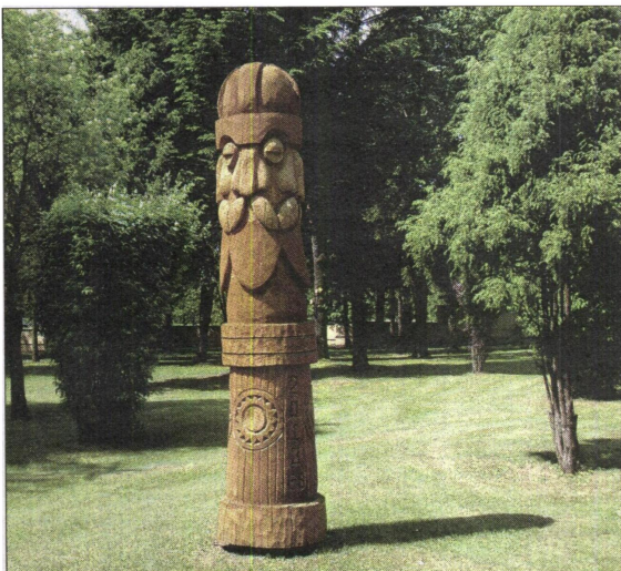
Aplinką puošiančios skulptūros buvo sukurtos per vasaros plenerus.